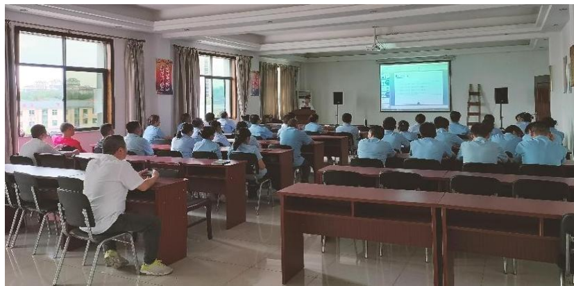
图片为：亚珀电气举办的信息化培训