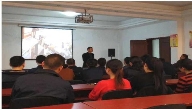
图片为：亚珀电气开展安全生产专项培训